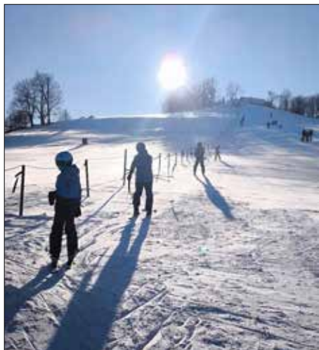
Skifahrer und Rodler kamen am Johannisstein voll auf ihre Kosten