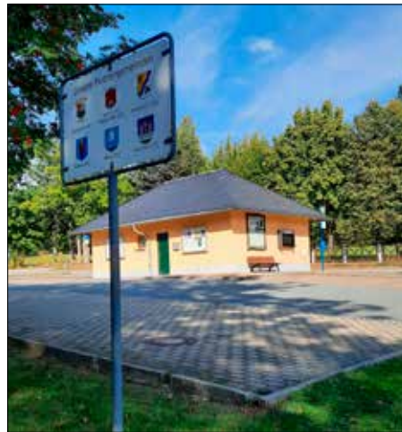
Am Parkplatz Kammstraße, Start- und Zielpunkt der „Mühlsteinwanderung Lückendorf“

Der erste Termin dieses Jahr ist in den Osterferien am Freitag, den 10. April. Im Mai findet die Wanderung am 25. Mai (Pfingstmontag) statt, Start jeweils 10.00 Uhr.