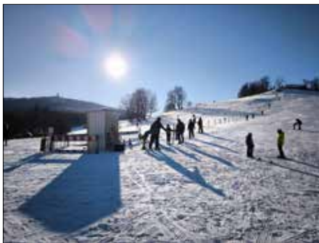
Es muss nicht immer ein entferntes Skigebiet sein. Vor der Haustür lässt sich auch Skifahren genießen.