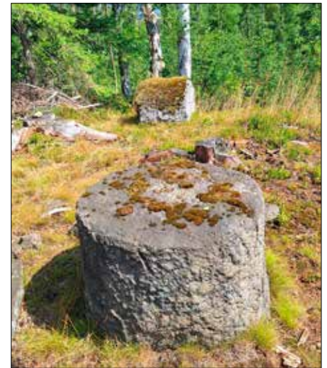
Am Mühlstein 19, Ende der geführten Wanderung