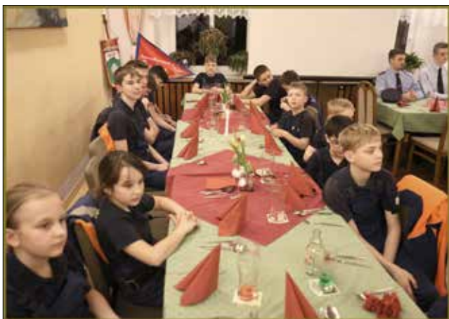
Die Jugendfeuerwehren von Lückendorf und Oybin waren natürlich auch anwesend bei der Jahreshauptversammlung